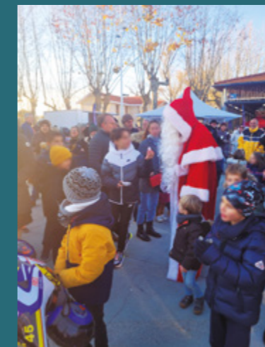
Noël à Audenge : un vrai plaisir pour petits et grands ! Merci aux 50 exposants qui ont contribué au succès de ce marché de Noël.