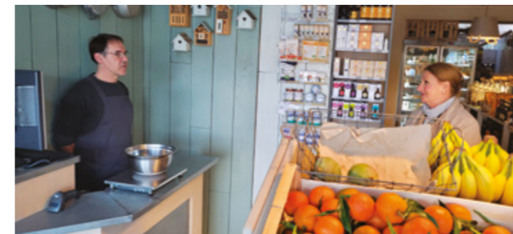
Au Gré du Bio