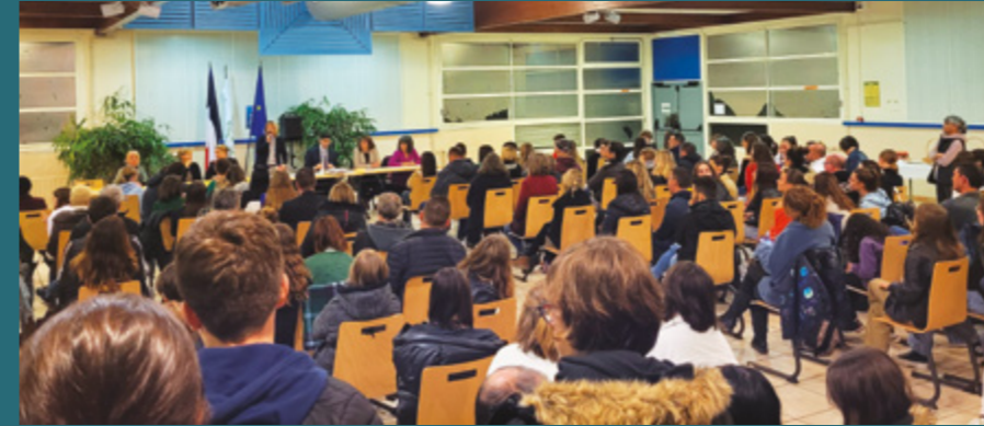
18 novembre - Collège Jean Verdier : remise des diplômes du Brevet des collèges.