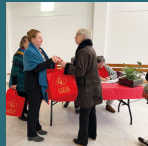
CCAS : remise des colis aux aînés de la ville d'Audenge en décembre.