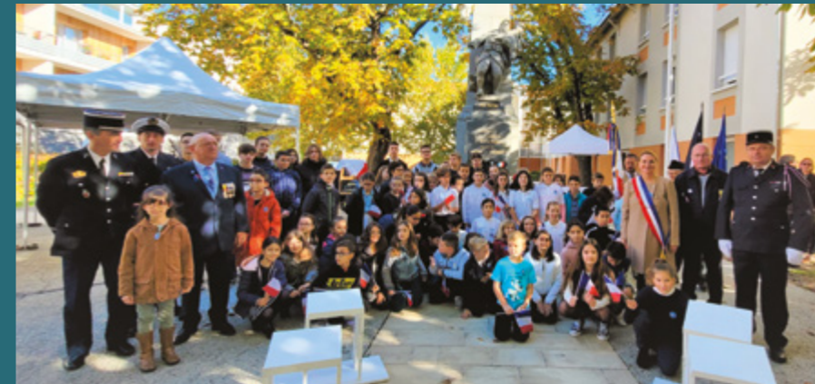
Cérémonie du 11 Novembre en présence de nombreux enfants.