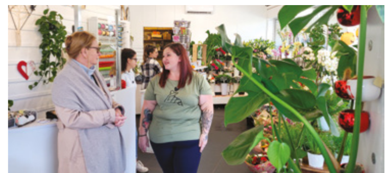
Fleur à Fleur