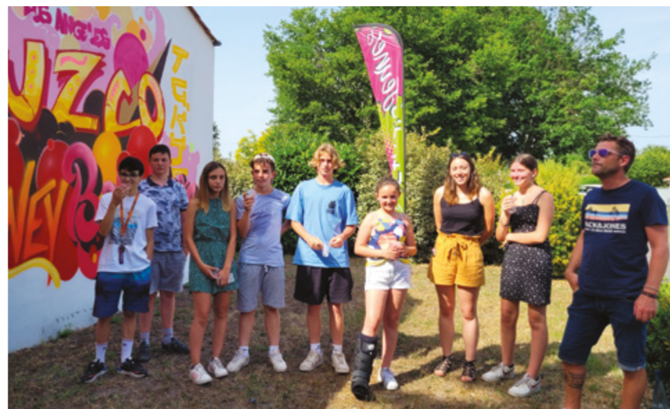
Les jeunes du Studio Jeunes et leurs animatrices et animateur.